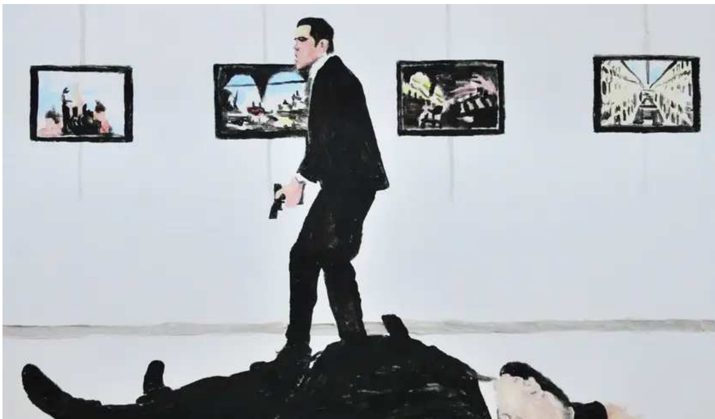
דוד ריב (2017), Bad Modern Art. לא חד-משמעי