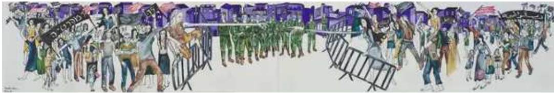
ראידה אדון, אני, את והדמוקרטיה, 2021 (לחצו להגדלה). מזכיר את "הפרודיג'י"

עוד אינם מסתירים את הציורים). מה שמתגנב חזרה לתוך המוזיאון מאחורי גב "המאבק" זו האמנות עצמה, מסנוורת בכוחה גם כשריינגולד (או האמן/ית עצמה/ו) משוכנעים ש"יש לה מסר".