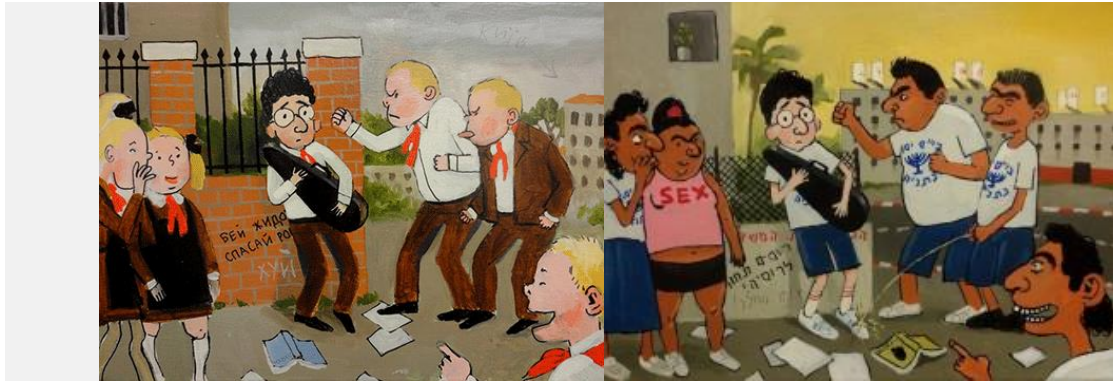
זויה צ'רקסקי – השפלה בבית הספר (דיפטיר). אקריליק וטושים על בד, 30/40 ס"מ כ"א, 2011

חשיפה זו של אנטישמיות בארץ מולדתה של צ'רקסקי היא ביקורת חריפה וכנה. היא מפנה אצבע מאשימה ובלתי מתפשרת כלפי כל התנהגות כוחנית ואלימה שהיא נתקלת בה. אלא שהביקורת כלפי המזרחים, הגם שהיא מודעת ומורכבת, היא היחידה שמעוררת זעם כזה, כנראה משום שהיא אינה מתיישבת יפה עם הפוליטיקלי-קורקט הישראלי הנוכחי.